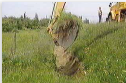
Excavation du fond du fossé à partir du talus opposé à la route, jusqu'à l'entaille.