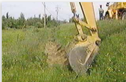
Découpage de la tourbe au point de contact entre le tiers inférieur et les deux tiers supérieurs.